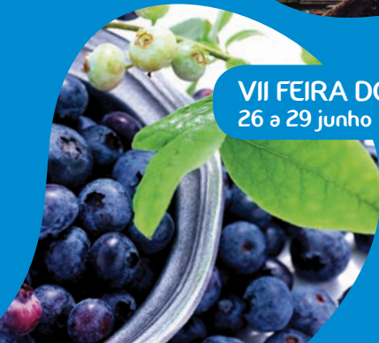
VII FEIRA DO MIRTILLO 26 a 29 junho