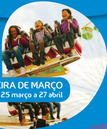
FEIRA DE MARÇO 25 março a 27 abril