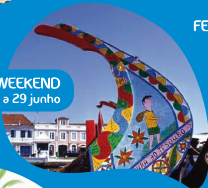
RIA DE AVEIRO WEEKEND 27 a 29 junho