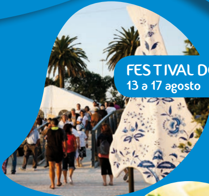
FESTIVAL DO BACALHAU 13 a 17 agosto