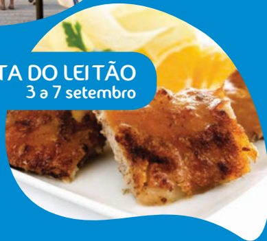
FESTA DO LEITÃO 3 a 7 setembro