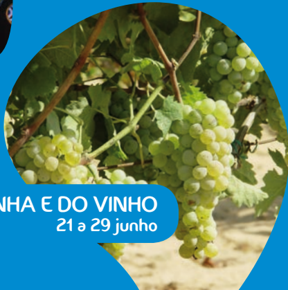
FEIRA DA VINHA E DO VINHO 21 a 29 junho